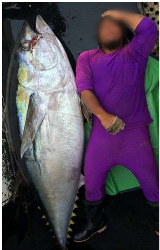
(圖) 一位漁工在釣到一條大鮪魚後在甲板上休息。