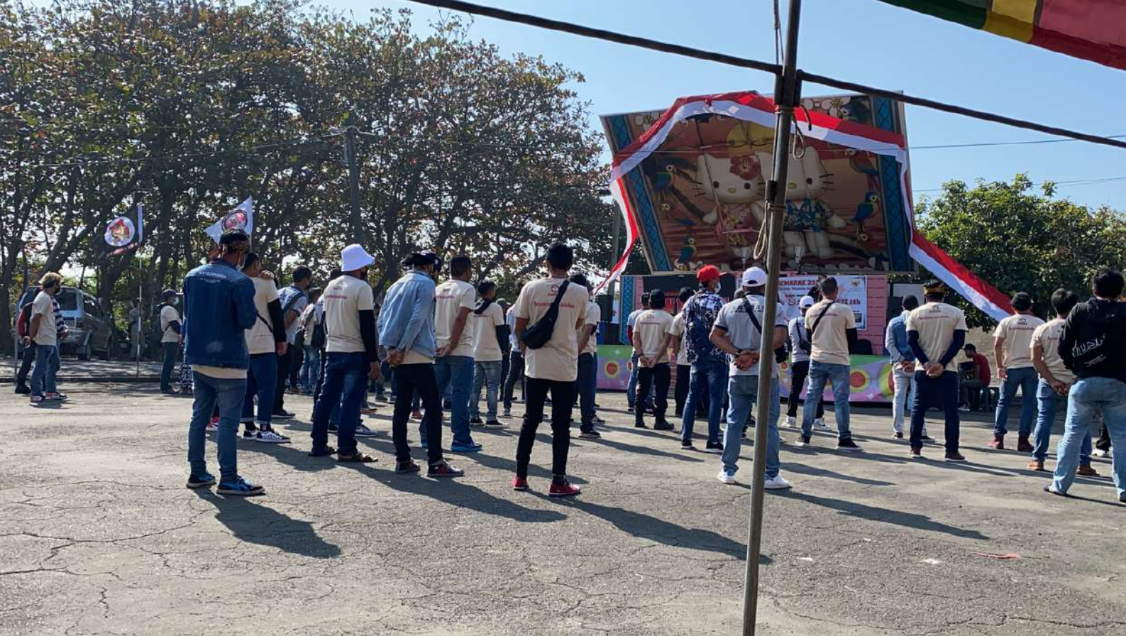
(圖) 在台灣漁船上工作的印尼籍漁工參與一個由屏東東港印尼海員同鄉會（FOSPI）舉辦的同樂活動。 照片來源：Mina Chiang/HRC。地點：台灣東港。